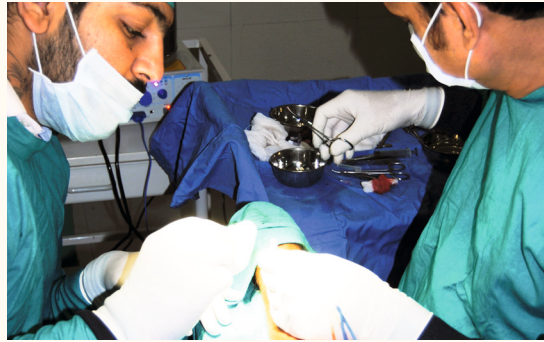
Anlage Dialyseshunt, OP-Saal im Bettentrakt, 2012

2015 waren vorübergehend klassische Medical Camps rechtlich kaum mehr möglich. Überbrückend wurden die Patienten an Sammelpunkten vom Ambulanzfahrzeug abgeholt und ins Krankenhaus gebracht.