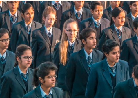
Academy, deutsche Austauschschüler, 2016