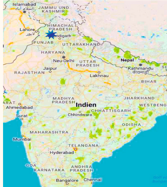
Karte Indiens, blauer Stern : Kirpal Sagar