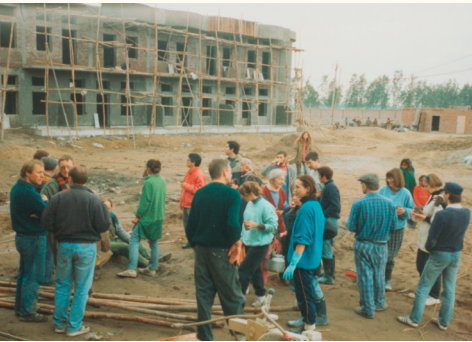
westliche Unterstützung, 1993