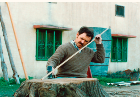
Ausrichten eines Vierkantstabes, 1985

Sarovar: inmitten der anderen Einrichtungen liegt ein künstlicher Teich mit einem Gebäude in der Mitte, das an ein Schiff erinnert. Sein Dach trägt gut sichtbar die Symbole der Einheit, als Hinweis auf das gleiche gemeinsame Ziel. In die Mauer um den Teich sind vier Räume integriert, in denen Bibel, Koran, Veden und Guru Granth Sahib, die heilige Schrift der Sikhs, ihren Platz finden. Wer will, kann dort auch Gottesdienste besuchen.