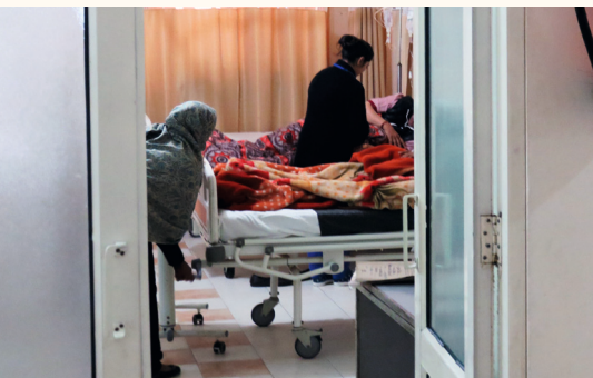
Aufnahmestation, Funktionstrakt, 2017