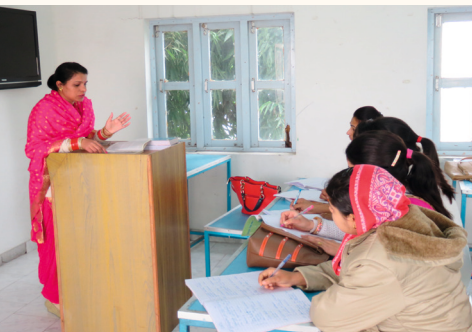
Seminar für Lehramtstudenten, 2017

Das Krankenhaus ist integraler Bestandteil von Kirpal Sagar, einem Ort, der allen Menschen offen steht, unabhängig von Nationalität, Hautfarbe, sozialer Herkunft, Religion oder anderen äußeren Kennzeichen. Von Anfang an konnten sich Freiwillige aus der ganzen Welt einbringen, sei es als Helfer beim Graben und Betonieren, bei Planung und Organisation, beim Reparieren und Renovieren, in der Begegnung mit anderen Menschen, Denkweisen und Kulturen.