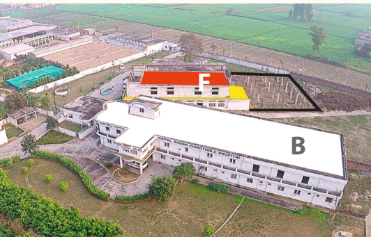
Bettentrakt vorne (B), Funktionstrakt hinten (F)

Der indische Monsun, die sommerliche Hitze und gelegentliche Sandstürme setzen den Gebäuden mehr zu als in unseren Breiten, so dass Instandhaltungsmaßnahmen fortlaufend erforderlich sind.