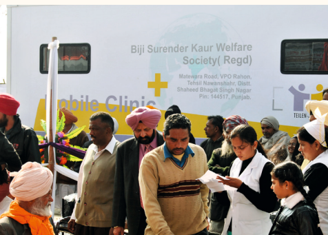
Indienststellung der mobilen Klinik, 2012