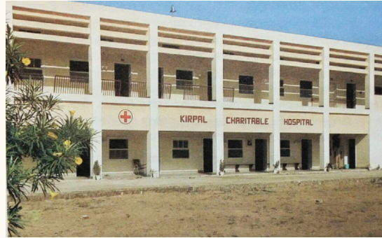
Multifunktionsgebäude, unten Krankenhaus, 1986