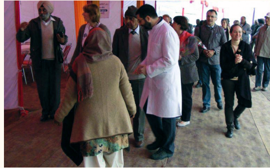
Eröffnung eines großen Camps, 2012

Medical Camps gemeinnütziger Träger werden in enger Abstimmung mit den lokalen Gesundheitsbehörden an Orten durchgeführt, die einerseits viele Bedürftige beherbergen und andererseits gesundheitlich unterversorgt sind.