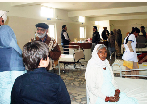
kurz vor einer Augen-OP