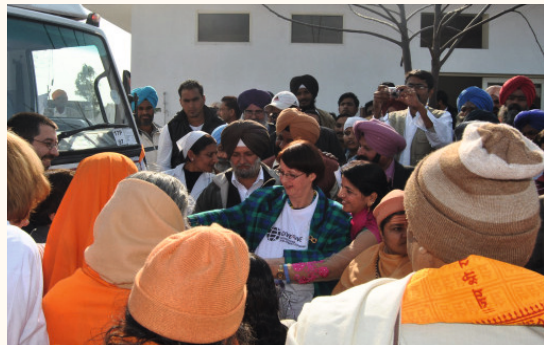
Mobile Klinik, Inbetriebnahme 2012