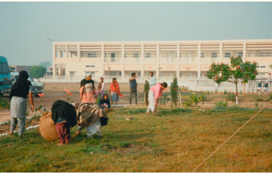
Multifunktion: vormals Krankenhaus, nun Internat