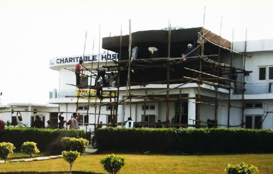
OP-Anbau, Bettentrakt, 2007

Ein richtiger Operationsraum samt OP-Mikroskop konnte im alten Gebäude nicht eingerichtet werden. 1991 wurde deshalb mit den Planungen für ein neues, an die Erfordernisse eines Krankenhauses angepasstes Gebäude begonnen (siehe auch Skizze Seite 20), das in mehreren Abschnitten errichtet werden sollte.