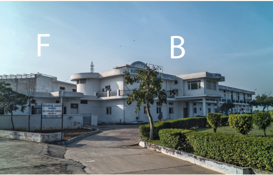
Funktionstrakt links (F), Bettentrakt rechts (B)