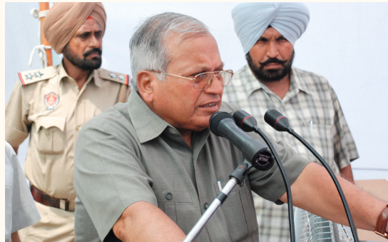
Eröffnung Funktionstrakt, Gesundheitsminister, 2012