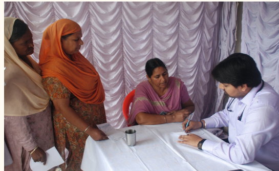
Medical Camp, Besprechung der Untersuchung