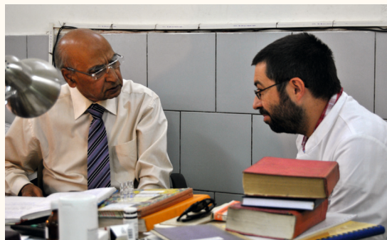
Erfahrungsaustausch unter Behandlern