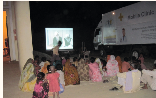
Informationsveranstaltung nach dem Camp, 2008

Gesundheit ist nicht alles, aber ohne Gesundheit ist alles nichts.