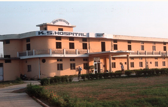
Neues Krankenhaus, 1995, nun Bettenrakt