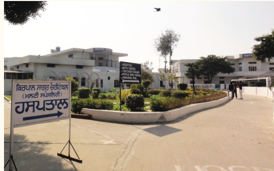
Kirpal Sagar, Wegweiser zum Krankenhaus

Welche Bedeutung hatten diese drei Personen für das Krankenhaus?